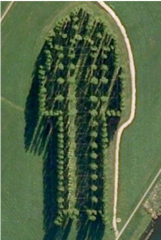
gotisch groeiprojekt ('groene kathedraal') Almere, 1978-1987 - heden