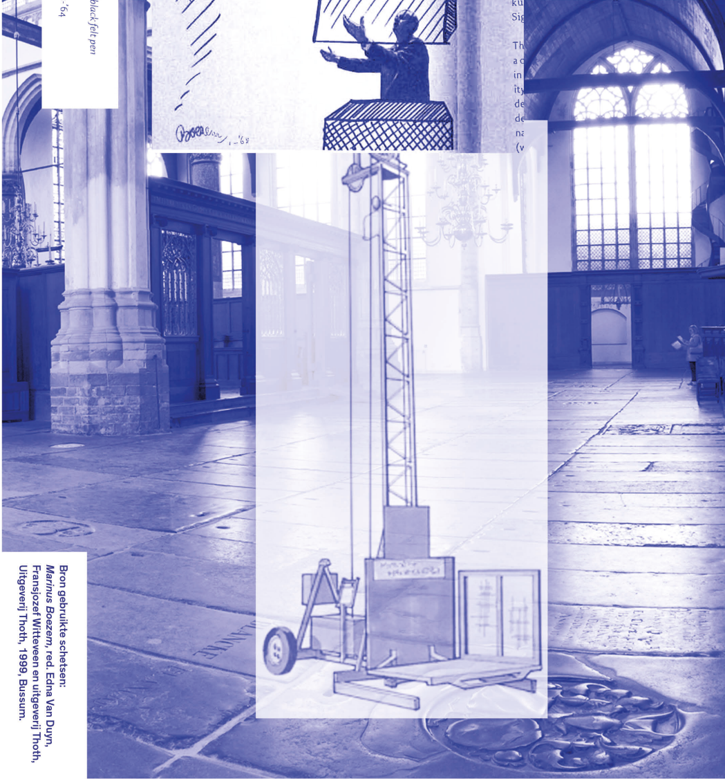
Bron gebruikte schetsen: Marinus Boezem, red. Edna Van Duyn, Fransjoze Wittewen en uitgeverij Thoth, Uitgeverij Thoth, 1999, Bussum.

Het oeu in 10 beu qua kos blik van pre visi pro 196 zat lin Dil ku Sig Th a c in ity de de na (v