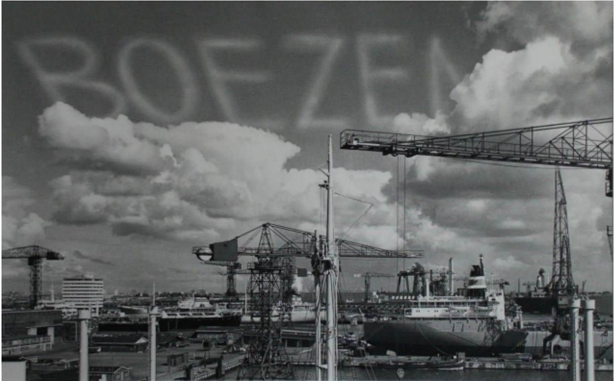
signing the sky above the port of amsterdam 1969