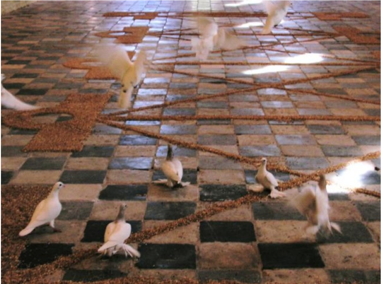
A volo d'uccello – in vogelvlucht 2010, Vleeshal Middelburg