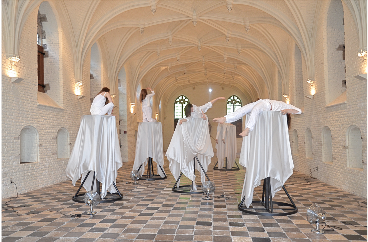
Performance met windtafels, Vleeshal Middelburg, 1996