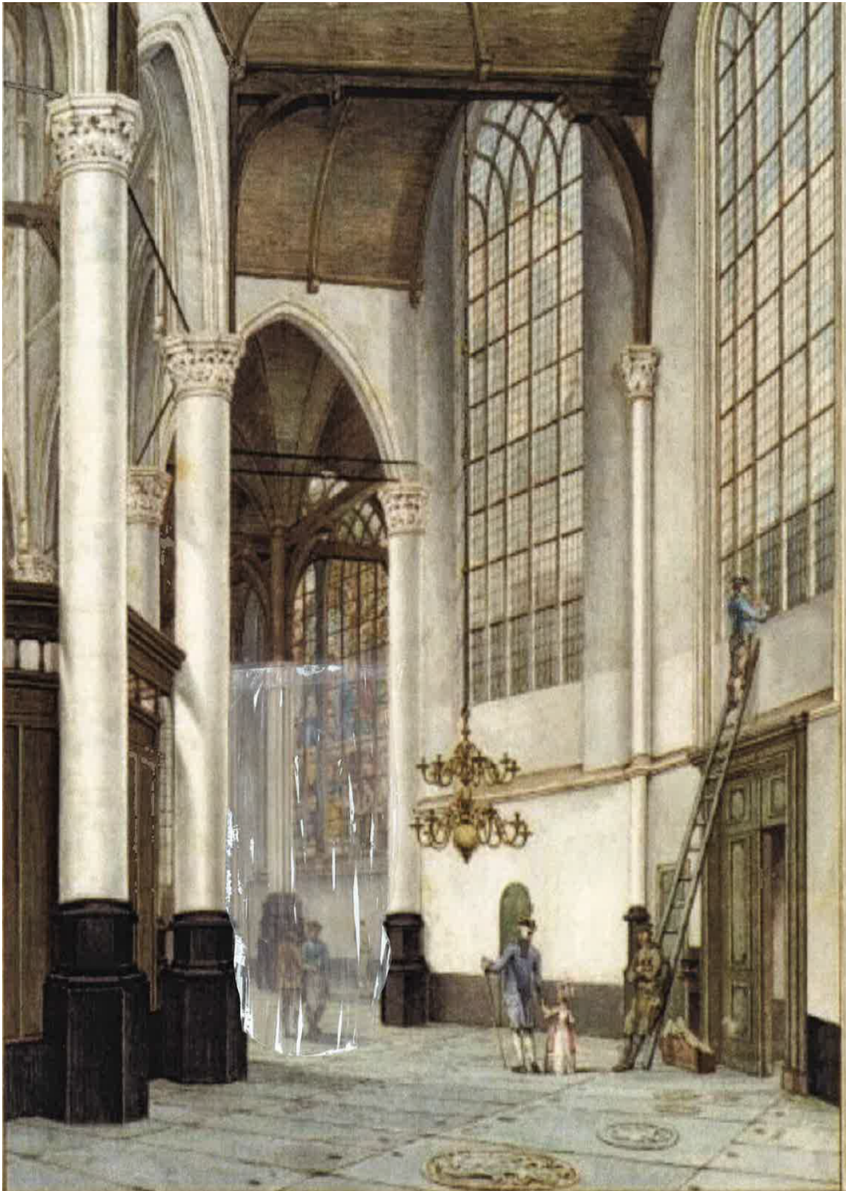
impressie labyrint, oude kerk 2016